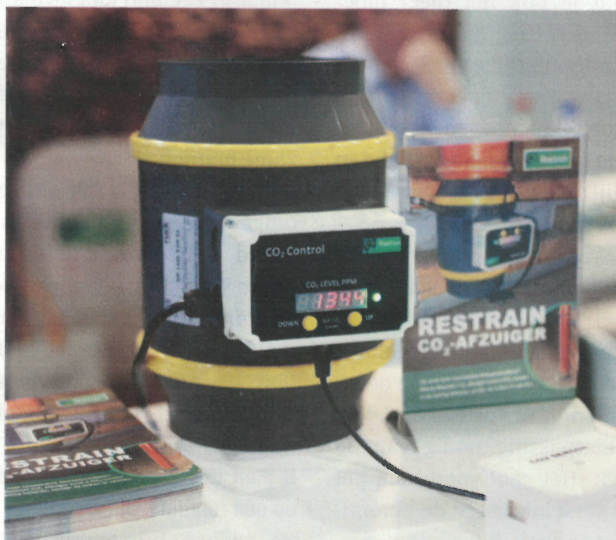
Restrain brengt de CO 2 -afzuiger in januari 2022 op de markt.

Het reguleren van het CO 2 -niveau was de laatste jaren lastig door wisselende weersomstandigheden in het voorjaar. Afgelopen lente was het relatief koud, waardoor de temperatuur in de bewaring snel daalde als telers de ventilatieluien openden. De twee lentes daarvoor waren warm. Zodoende liep de temperatuur juist te snel op bij het openen van de luiken. De CO 2 -afzuiger kan deze schommelingen voorkomen.