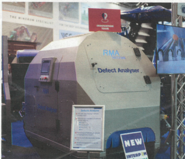
De machine is uitgevoerd in roestvrijstaal.

Machinefabrikant RMA-techniek in het Zeeuwse 's Heer Arendskerke heeft een nieuwe machine ontwikkeld voor het classificeren van aardappelen. Het apparaat detecteert autonoom defecten op de knollen. Hierdoor zijn menselijke handelingen niet meer nodig en worden fouten voorkomen.